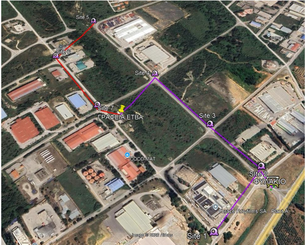
Εικόνα 1: Σημεία Τοποθέτησης Καμερών – Ε.Π. Ξάνθης